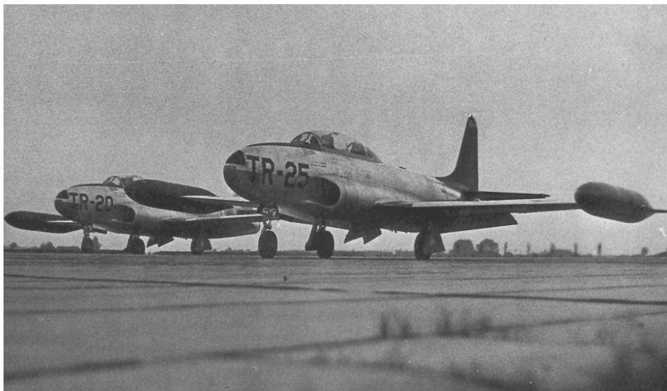
Lockheed T 33 TR-20 en TR-25 op basis Eindhoven. Cor vloog de TR-22.