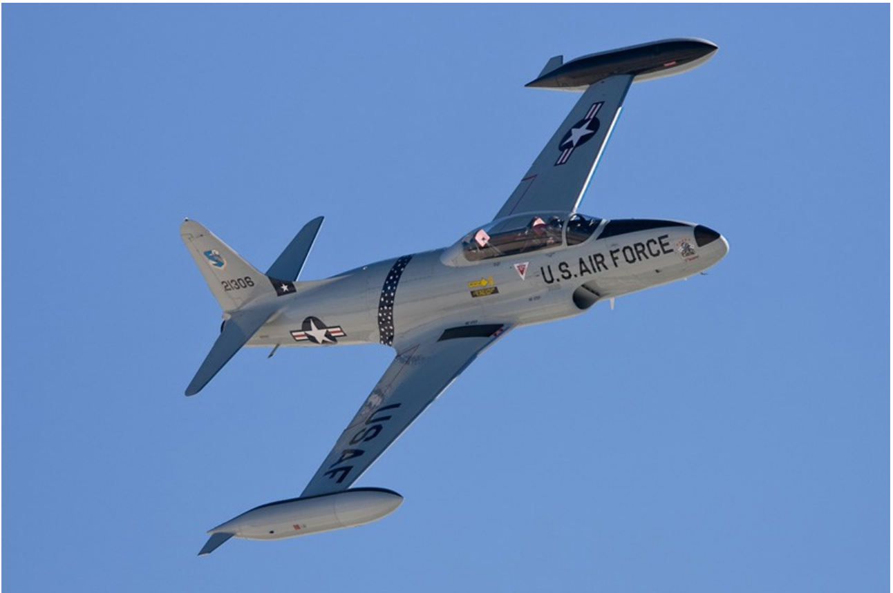
Lockheed T 33 in USA Airforce kleuren